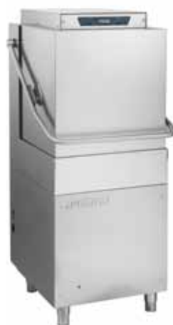
AH 1200 DGT