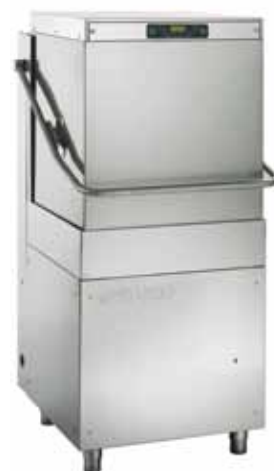
AH 1400 ELT