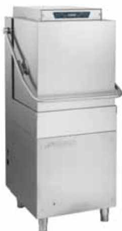
AH 1100 DGT