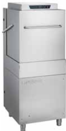
AH 1000 EASY

The Aristarco hood dishwasher range can be equipped upon request with dishwasher tabling (both inlet and outlet) to create a small "conveyor system" for more efficient washing, ideal for medium-sized catering businesses.