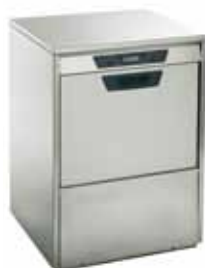
AU-S 55.40 DGT